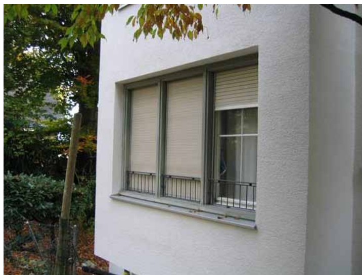
Darf man auf die Dämmung der Leibung verzichten?

Sie zeigt uns Beispiele von zahlbaren energetischen Sanierungen, welche auf mitunter unüblichen Konzepten und Ansätzen basieren.