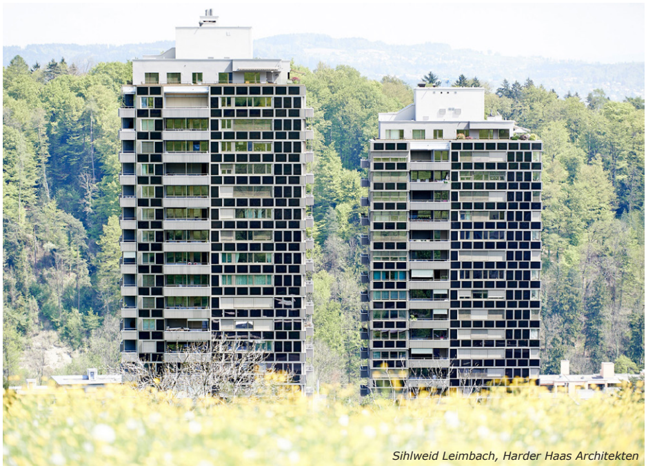
Sihlweid Leimbach, Harder Haas Architekten

Gründe für den Entscheid sind deswegen häufig eher von den Mietern bzw. Vermietern abhängig – Genossenschaften haben meistens gar keine Möglichkeit, ihre Genossenschaftler während einer Sanierung umzuplatzieren, während Privateigentümer oder Institutionelle häufig daran interessiert sind, möglichst grosse Wertsteigerungen und damit einhergehende Mieterhöhungen realisieren zu können.