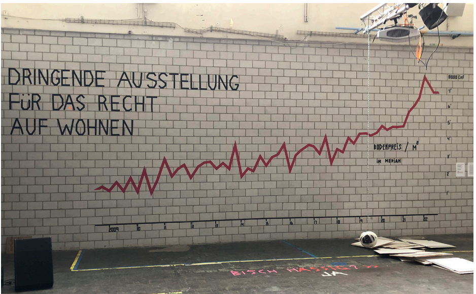
Darstellung in der «Dringenden Ausstellung für das Recht auf Wohnen» in der Zentralwäscherei Zürich, Bodenpreis pro Quadratmeter (Statistik Stadt Zürich), Foto: Katrin Pfäffli, April 2023